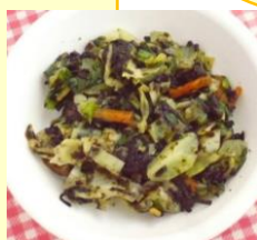
東京都日野市立 保育園給食より

海苔は 想像もできないほど多くの栄養素 を含んでいるため朝から元気に活動できるようにしてくれる食品です。 とても低カロリーなのであまり栄養がないのでは？ と思う方もいらっしゃるかもしれませんが、とんでもないです。